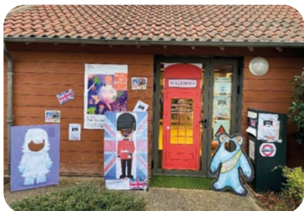
Pour l'occasion, nouveau look «so british» pour la bibliothèque.

Dans le cadre des «Nuits de la lecture», dont le thème était «relire le monde», nous avons proposé un conte en anglais pour les enfants animé par Claire.