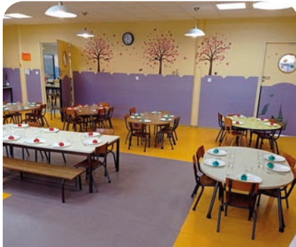
Repas de Noël à l'école