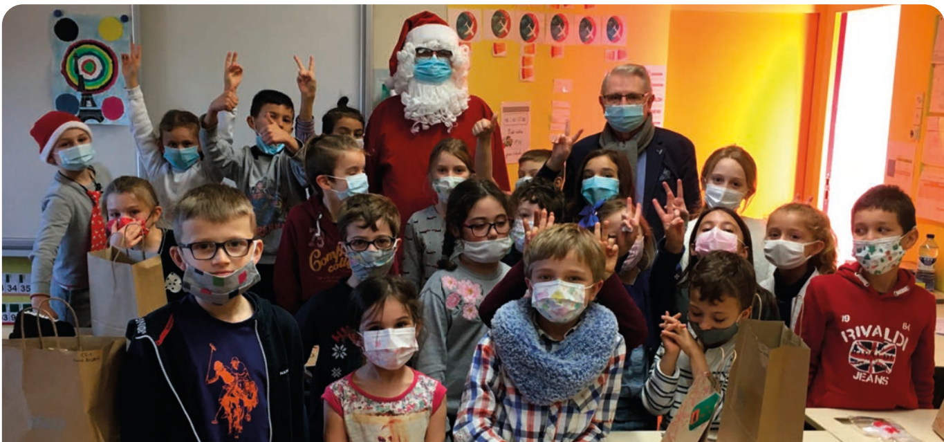
La visite du père Noël à l'école