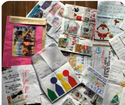
Les lettres au Père Noël

Remercions tous les lutins qui ont participé à ce moment de magie et espérons que les enfants soient encore aussi sages durant cette nouvelle année !