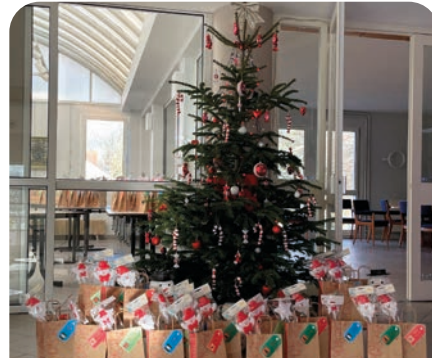
Les nombreux cadeaux