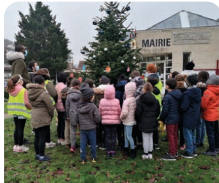
Le centre de loisirs décore le sapin